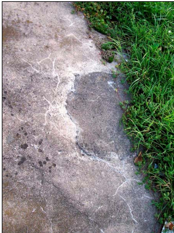
▲ [5008682] Die Betonplatte nördlich des westlichen Fundaments: Mit Beton aufgefülltes Loch.