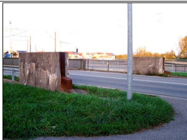
◄ [5005212] Ansicht aus dem Südwesten.