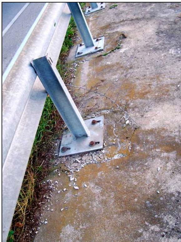
◀ [5008683] Die Betonplatte nördlich des westlichen Fundaments: Die Stützen der Leitplanke wurden wahrscheinlich zufällig nach dem fast gleichen Muster wie die östliche Reihe von Löchern angeordnet.