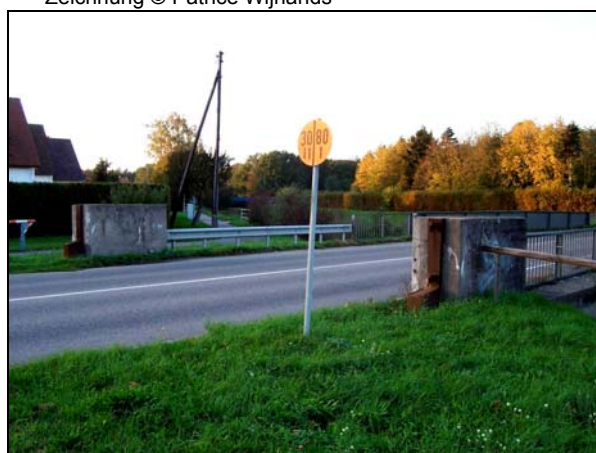
▲ [5005211] Ansicht aus dem Südosten.