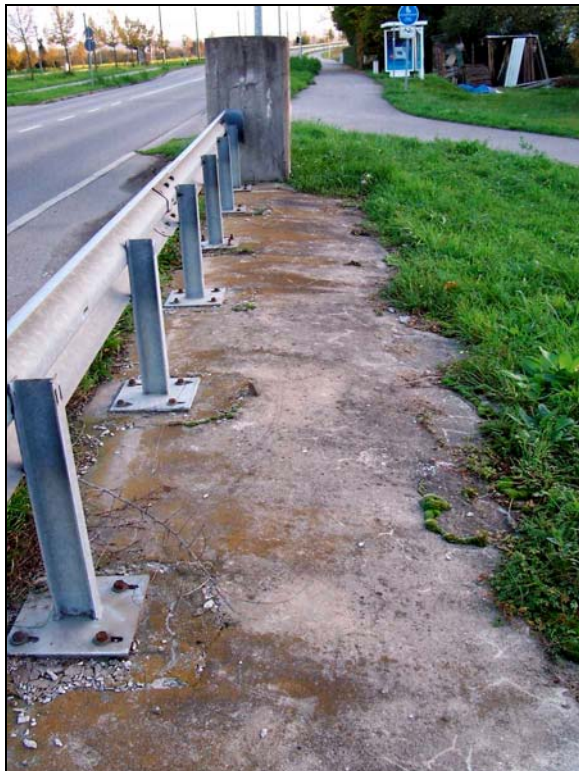
▲ [5008681] Die Betonplatte nördlich des westlichen Fundaments mit aufgefüllten Löchern in zwei zu einander versetzten Reihen.